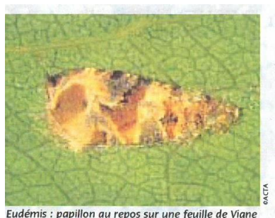
Eudémis : papillon au repos sur une feuille de Vigne

Dans notre région ce sont principalement l'Eudémis et la Cochylis qui sont présentes.