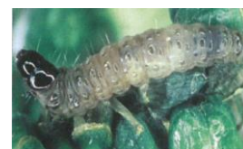
Larve de Cochylis