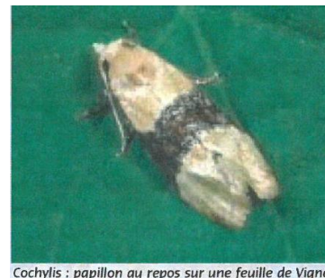
Cochylis : papillon au repos sur une feuille de Vigne

La différence principale entre ces deux espèces réside dans le nombre de générations : deux générations pour la Cochylis, trois générations pour l'Eudémis.