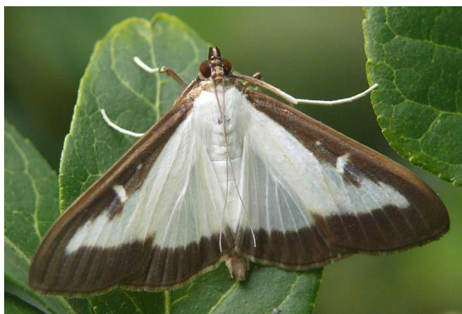
Photo : Papillon de pyrale du buis