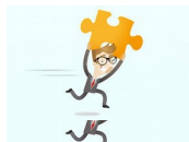
Porteur de projet

Communauté d'Agglo Sophia Antipolis (CASA) : 24 communes