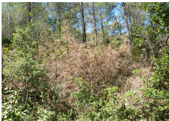
Sous bois défolié dans l'Hérault