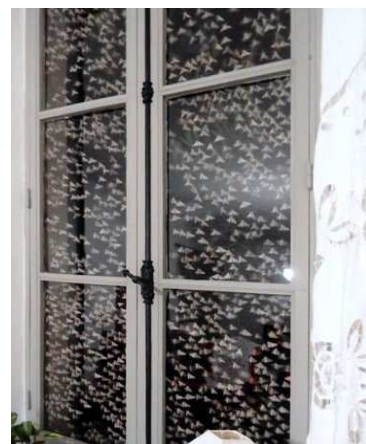
Infestation à Marsanne(26)

Si le piégeage de masse peut être efficace sur les foyers de buis ornementaux, il s'avère inefficace dans le cas des pullulations en forêts qui réunissent des milliers d'individus.