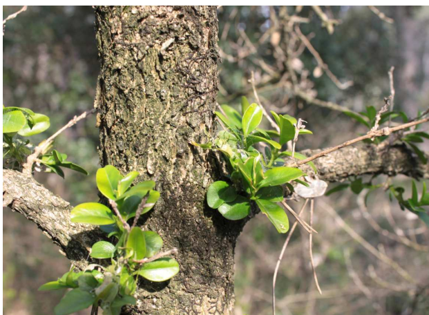
Repousses suite à la défoliation.

Les défoliations totales peuvent avoir un impact fort sur la vitalité de cet arbuste constituant le sous-étage forestier. Les arbres de l'étage dominant peuvent aussi être impactés par la modification de l'ambiance forestière .