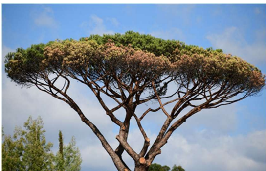
Figure 1 : Pin pignon infesté avec rougissement des aiguilles

Pour repérer la cochenille tortue du pin, vous pouvez observer la production de miellat, substance sucrée et collante qui se dépose sous les pins ou à la base des aiguilles sur les rameaux. Sur le miellat, un champignon de couleur noire (fumagine) va se développer. Le pin peut ensuite présenter un rougissement puis le dessèchement des pousses. L'affaiblissement général peut aller jusqu'à la mort des arbres dans des conditions de stress particulier (manque d'eau, sol pauvre...).