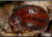
3,5 à 5 mm