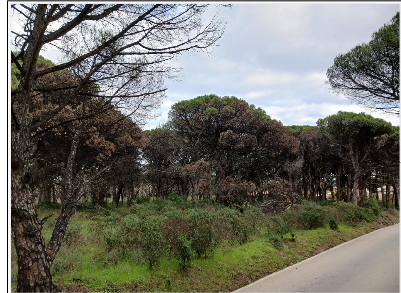
Ramatuelle le 10 décembre 2025