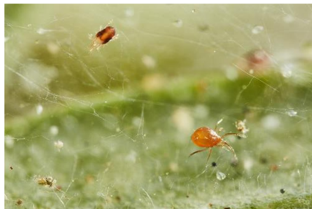
Acarien tétranyque en haut à droite et P.persimilis en bas à gauche

Des cycles courts de brumisation aux heures les plus chaudes de la journée limitent le développement des acariens tétranyques et favorisent celui des phytoséiides comme Phytoseiulus persimilis .