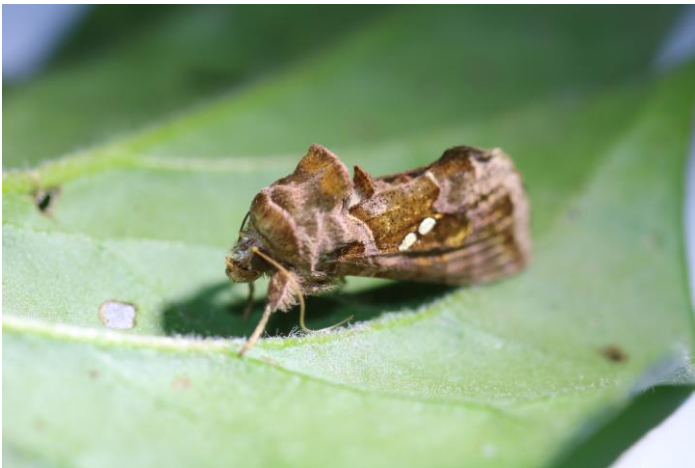
Chrysodeixis chalcites adulte

Le risque de pontes et surtout de la présence de chenilles sur les cultures est modérément élevé sur le site de Hyères qui enregistre une moyenne journalière de 6 individus piégés en semaine 26.