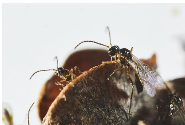
Aphidius colemani adultes