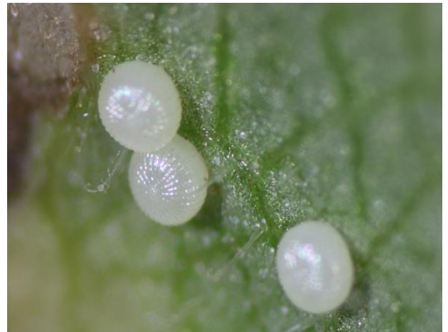
Chrysodeixis chalcites oeufs