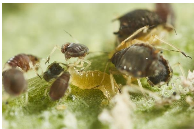
Larve d' Aphidoletes aphidimyza sur foyer de pucerons