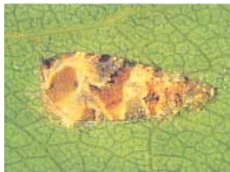
Adultes au repos sur feuille de vigne