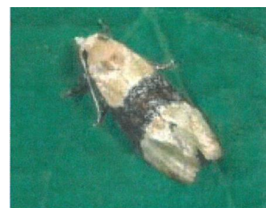
Cochylis : papillon au repos sur une feuille de Vigne