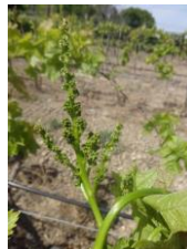
stade H (10-13f étalées)