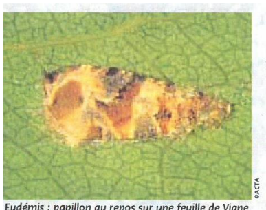
Eudémis : papillon au repos sur une feuille de Vigne