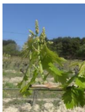
Stade G (8-9f étalées)