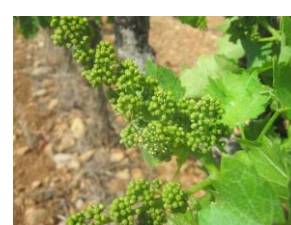
stade I (1ères fleurs)