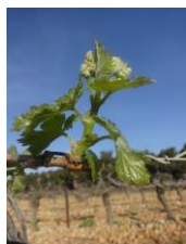
Stade F (5-6f étalées)