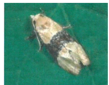
Cochylis : papillon au repos sur une feuille de Vigne