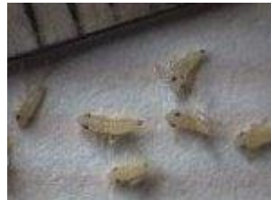
larves de Scaphoideus titanus