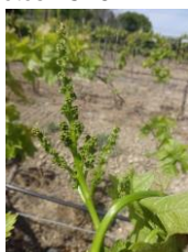
stade H (10-13f étalées)