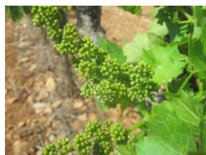
stade I (1ères fleurs)