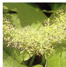
Stade I (pleine floraison)