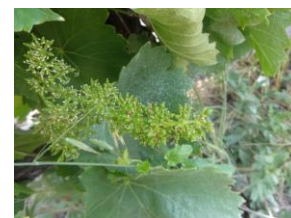
Stade J (nouaison)