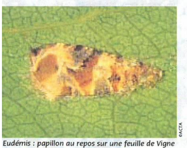
Eudémis : papillon au repos sur une feuille de Vigne