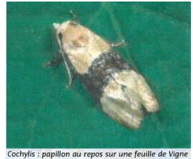
Cochylys : papillon au repos sur une feuille de Vigne