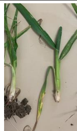
Dégâts de mouche ; pied en poireau et dernière feuille courte

Evaluation du risque : Elevé. Etant présente partout, elle semble s'implanter durablement dans la Région. Au niveau du risque de dégâts sur le rendement : si les blés de la parcelle touchée sont à des stades avancés (1 ou 2 nœuds) et qu'ils sont en stress hydrique avec des régressions de talles : il y aura un impact sur le rendement. Sinon si les talles se portent bien, elles vont compenser la perte du maître brin, un impact quasi nul est alors à prévoir.