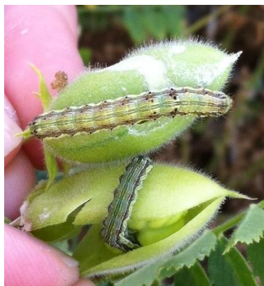
Chenilles d' H. armigera dans gousses de pois chiche

Le suivi de ce ravageur est réalisé avec des pièges en végétation qui permettent de détecter la présence de papillons et suivre les vols. Pour 2020, 34 pièges sont déployés sur le territoire.