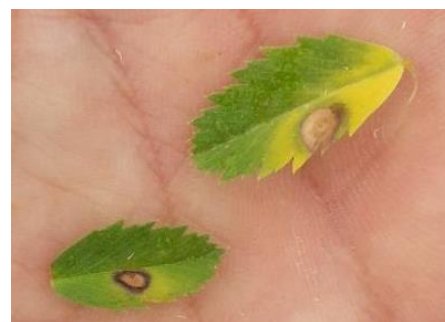
Symptômes d'ascochyte sur feuilles

La période d'observation habituelle de la maladie se situe autour de la floraison. Les symptômes de l'ascochyte sont reconnaissables grâce aux nécroses avec cercles concentriques de pycnides sur feuilles, tiges et gousses (voir photo ci-contre). La maladie se conserve sur les résidus de culture et les semences.