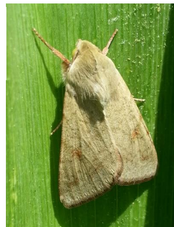
Papillon d' H. armigera - Ph Papillon d' H. armigera - Photo FREDON Aquitaine

Le vol est toujours en peu intense cette semaine. Signe qu'un pic de vol est passé. Attention, il y aura certainement d'autre pic de vol dans les semaines qui viennent. Cette semaine, 3,4 papillons sont piégés en moyenne sur le territoire. Les départements avec au moins 1 papillon piégé : 13, 26, 30, 34, 84. Les pièges dans le département de l'Hérault sont ceux qui ont piégés le plus cette semaine (10, 10 et 14 papillons). Les conditions climatiques sont propices au piégeage et les parcelles sont en plein dans la période de risque (dès apparition des premières gousses).