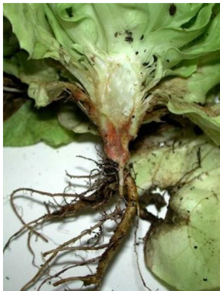
Coloration rouge des vaisseaux du pivot d'une salade atteinte