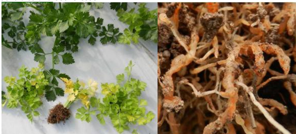
Attaque de nématodes à galles sur céleri (BSV maraîchage du 16 octobre 2015)

La croissance de la plante ralentit, les feuilles jaunissent. Les plantes infestées deviennent très sensibles à la sécheresse.