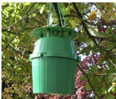
Photo : piège à entonnoir