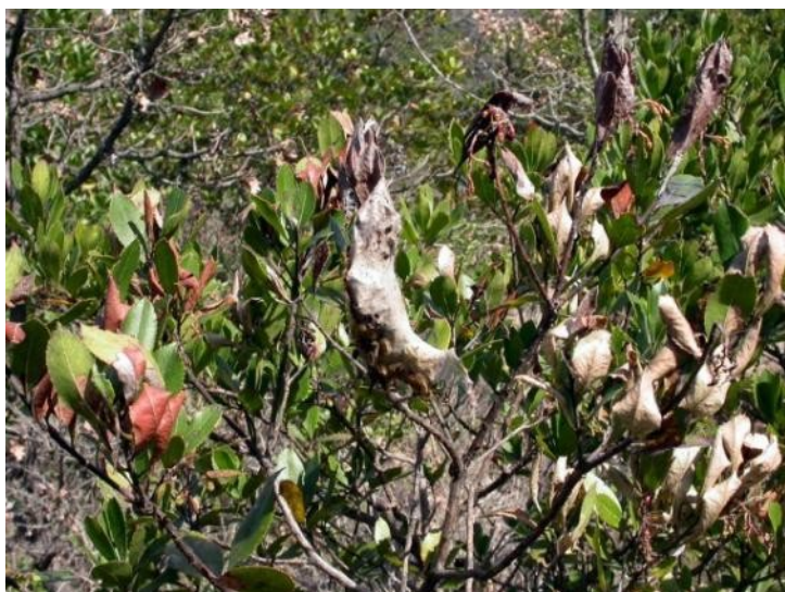
Photo : nid sur arbousier

Ces nids ressemblent aux nids de processionnaire du pin, il s'agit cependant d'une autre espèce : le bombyx cul brun.