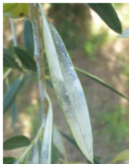
Feutrage grisâtre sur la face inférieure des feuilles, symptôme de présence de cercosporiose (CTO)

Face aux conditions climatiques à venir, le risque de développement de la maladie est élevé sur parcelles avec présence de symptômes et faible à moyen sur parcelle exempt de symptômes.