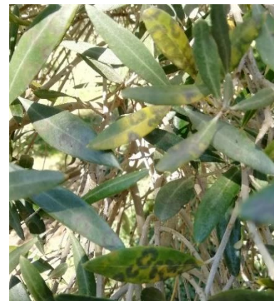
Symptômes caractéristiques de l'œil de paon (AFIDOL)

Face aux conditions climatiques à venir, le risque de développement de la maladie est élevé sur parcelles avec présence de symptômes et faible à moyen sur parcelles exemptes de symptômes.