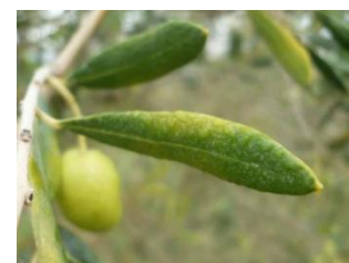
Jaunissement des feuilles, symptômes de présence de cercosporiose (CTO)