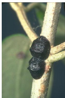
Cochenille noire de l'olivier (INRA)