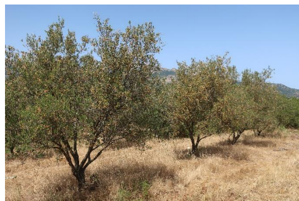
Feuillage jaunissant, symptômes de la cercosporiose (CTO)

Feuillage grisâtre sur la face inférieure des feuilles, symptôme de présence de cercosporiose (CTO)