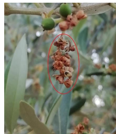
Coulures de fleurs dues à la sécheresse

Sur plusieurs secteurs, une mauvaise nouaison a été observée. Il a été constaté des grappes florales entièrement desséchées (cf. photo). Plusieurs phénomènes peuvent, en partie, expliquer ces dégâts : la sécheresse depuis le début de l'année, une défoliation très importante cette année causée par le développement élevé des maladies fongiques, ou bien encore un épisode gélif survenu à la fin du mois de mars dans le Var et les Alpes-de-Haute-Provence qui a pu endommager les bourgeons floraux.