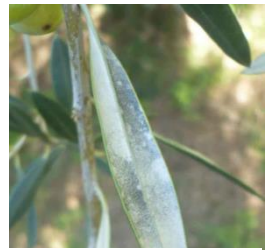
Feutrage grisâtre sur la face inférieure des feuilles, symptôme de présence de cercosporiose (CTO)