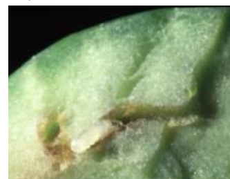
Observation à la loupe de la larve de la mouche de l'olive et de sa galerie (France Olive)