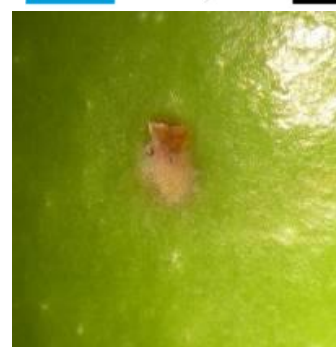
Piqûre de mouche de l'olive grossit à la loupe