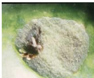
Observation de l'œuf de la mouche de l'olive à la loupe (France Olive)