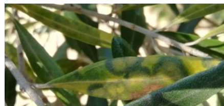
Symptômes visibles de l'œil de paon (France Olive)

De nouveaux foyers sont observés sur certains vergers.