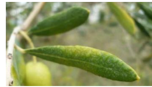
Jaunissement des feuilles, symptôme de présence de cercosporiose (CTO)

L'humidité au sein des vergers et les températures annoncées créent un climat favorable au développement de la cercosporiose. Selon la présence ou non d'inoculum dans vos parcelles, le risque reste modéré à risque fort.