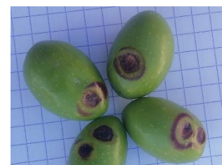
Tâches de dalmaticose observées sur Picholine (France Olive)