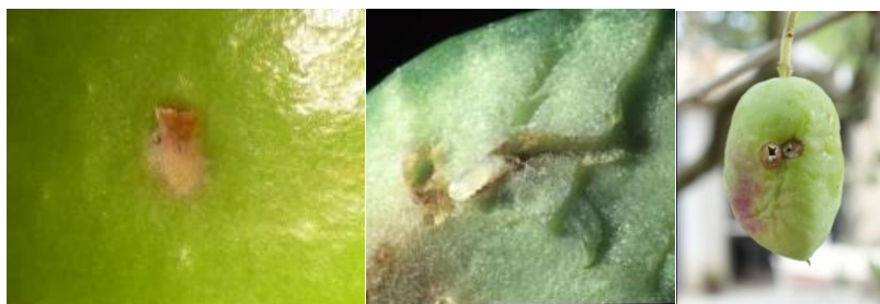
Symptômes visibles de l'évolution d'une piqûre de mouche : de gauche à droite, piqûre de ponte, galerie larvaire, trou de sortie

Sur les vergers avec une méthode de lutte à jour, faible évolution des dégâts.