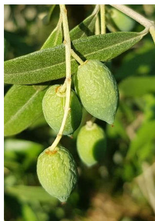
Olives fripées

Des olives fripées sont toujours observées en vergers non irrigués.