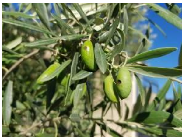
Olives touchées par la Dalmaticose

Son développement est fortement corrélé avec les piqûres d'insectes et les blessures sur le fruit (grêle).