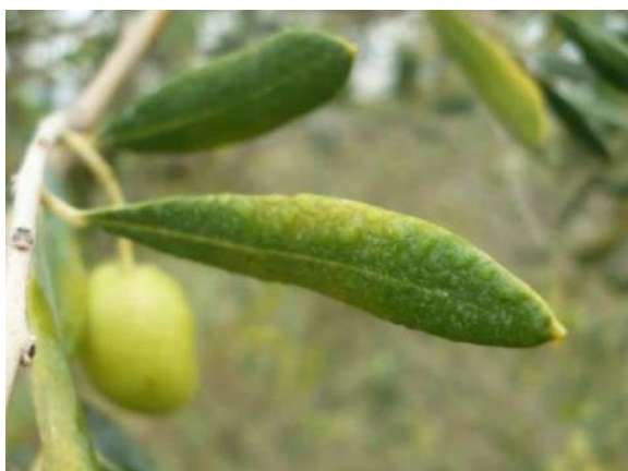
Symptômes observés sur la face supérieure des feuilles (CTO)