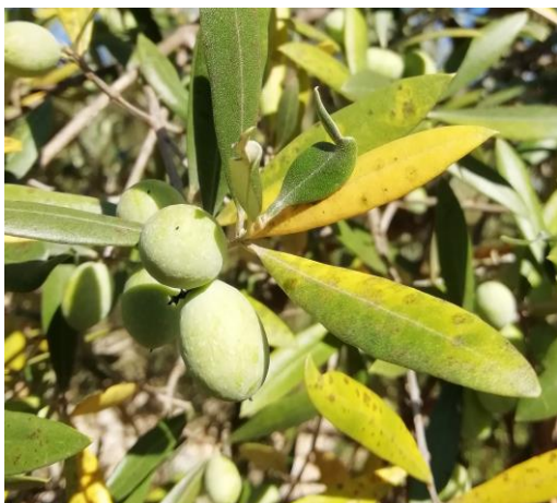
Nouveaux foyers d'œil de paon observés dans le Var (AFIDOL)