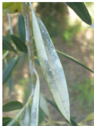
Taches grisâtres observées sur la face inférieure des feuilles (CTO)