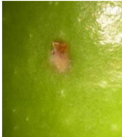
Grossissement piqûre de ponte de mouche de l'olive