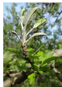
Foyer primaire d'Oïdium

La gestion de parcelles vis-à-vis de l'oïdium devra s'effectuer en tenant compte de la sensibilité variétale et de l'importance des dégâts en cours. Les mesures prophylactiques sont à privilégier (suppression des rameaux atteints).