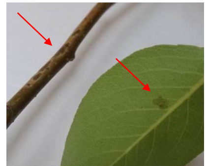
Photos : Taches de tavelure sur fruits (Williams), feuilles et rameaux