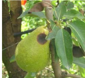
Stemphyliose sur fruits

Estimation du risque : la période à risque s'étend de la floraison jusqu'à la récolte (automne). La période de risque important sur fruits débute à partir de mi-mai. Les conditions chaudes et humides (rosées, irrigation) sont très favorables au développement du champignon pathogène.