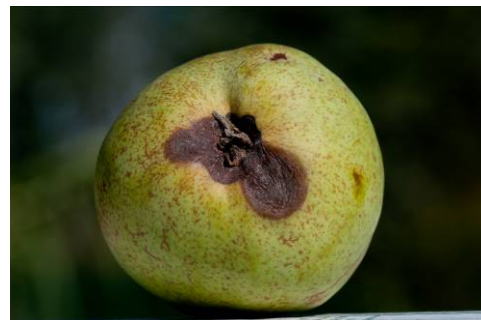
Tache nécrosée à l'œil

Coupe transversale de la cavité pistillaire avec présence de 2 individus globuleux (taille environ 0.5 mm)