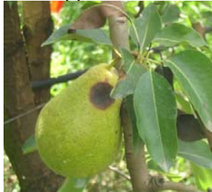
Stemphyliose sur fruits

Estimation du risque : la période à risque s'étend de la floraison jusqu'à la récolte (automne). La période de risque important sur fruits débute à partir de mi-mai. Les conditions chaudes et humides (rosées, irrigation) sont très favorables au développement du champignon pathogène.