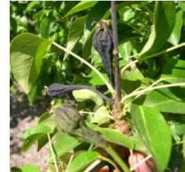
Feu bactérien sur bouquet de fruits (poirier)