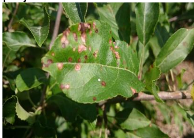
Black rot sur feuilles

Estimation du risque : En vergers à risque les orages peuvent provoquer des projections. Surveiller les fruits situés au bas des arbres.