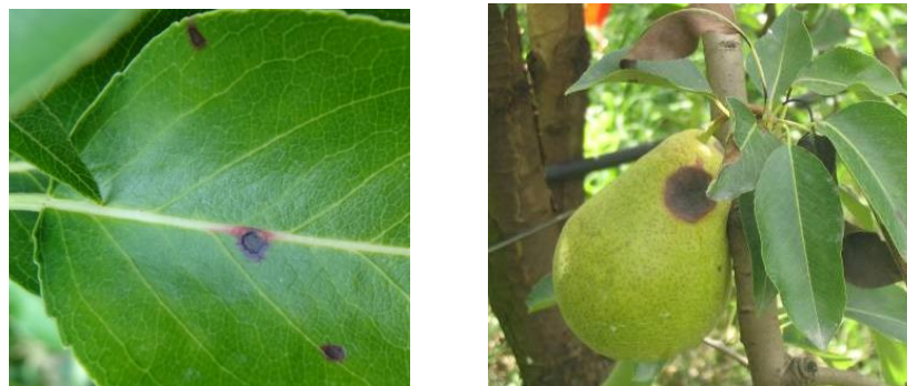
Stemphyliose sur feuille avec halo rouge (à gauche) et sur fruits (à droite), pourriture sur la joue du fruit souvent en cercles concentriques

Estimation du risque : La période à risque s'étend de la floraison jusqu'à la récolte (automne). La période de risque important sur fruits débute à partir de mi-mai. Les conditions chaudes et humides (rosées, irrigation) sont très favorables au développement du champignon pathogène. Pendant la saison estivale, une humectation de 6 heures suffit à créer les conditions favorables à une contamination.