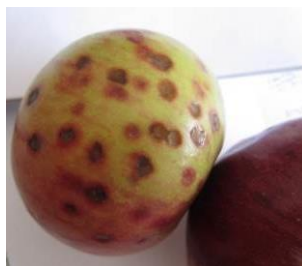
Black rot sur fruits