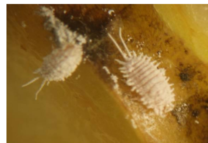
Pseudococcus sur fruits

La présence de larves sur fruits peut conduire à des dégradations de la qualité en conservation.