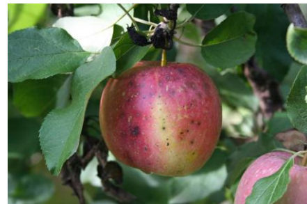
Black rot sur fruits (source : CEFEL)