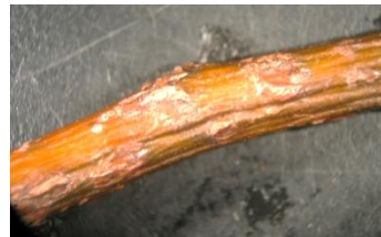
Photos : Taches de tavelure sur fruits (Williams) et chancre sur rameaux