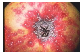
Pou de San José sur fruits

Estimation du risque : Repérer les parcelles atteintes.