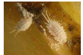
Pseudococcus sur fruits (taille environ 2 mm) (La Pugère)

Estimation du risque : Surveiller l'installation sur fruits.