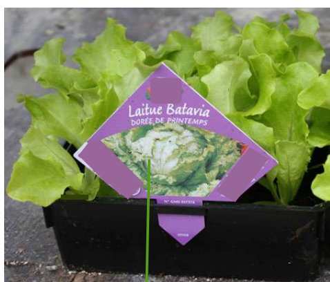
PP imprimé au dos

Exemples non exhaustifs d'apposition de Passeport Phytosanitaire :