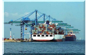
Port de Marseille-Fos

l'importation une des clés de voûte de notre système sanitaire.