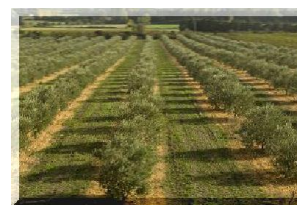
Oliviers de Provence (source MAAF)

Protéger nos cultures contre les dangers sanitaires majeurs et contrôler la distribution, l'application et l'utilisation des intrants (dont les produits phytosanitaires) dans le triple objectif d'assurer la protection des opérateurs, la protection de l'environnement et de la santé du consommateur sont les missions principales :