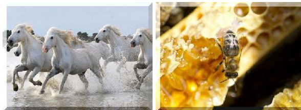
Chevaux camarguais Production apicole

Ces contrôles ont donné lieu à 157 suites administratives et 38 procédures pénales .