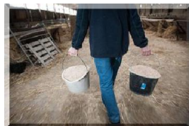
Alimentation animale (source MAAF)

Les DD(CS)PP ont également en charge le contrôle de l'application de la réglementation relative à la santé et à la protection des animaux d'élevage ou domestiques. Cette réglementation couvre aussi la pharmacie vétérinaire, l'alimentation animale, l'identification et le mouvement des animaux.