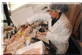
Contrôle sanitaire des aliments

Ces contrôles ont donné lieu à 1592 suites administratives (dont 40 fermetures administratives) et 157 procédures pénales .