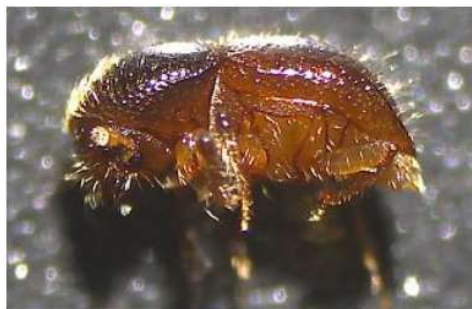
Adulte X. crassiusculus

4) détection de Xylosandrus crassiusculus dans le 82 par le conservatoire des espaces naturels lors d'un piégeage. Insecte polyphage de feuillus originaire d'Asie. Aucun dégât constaté pour le moment.