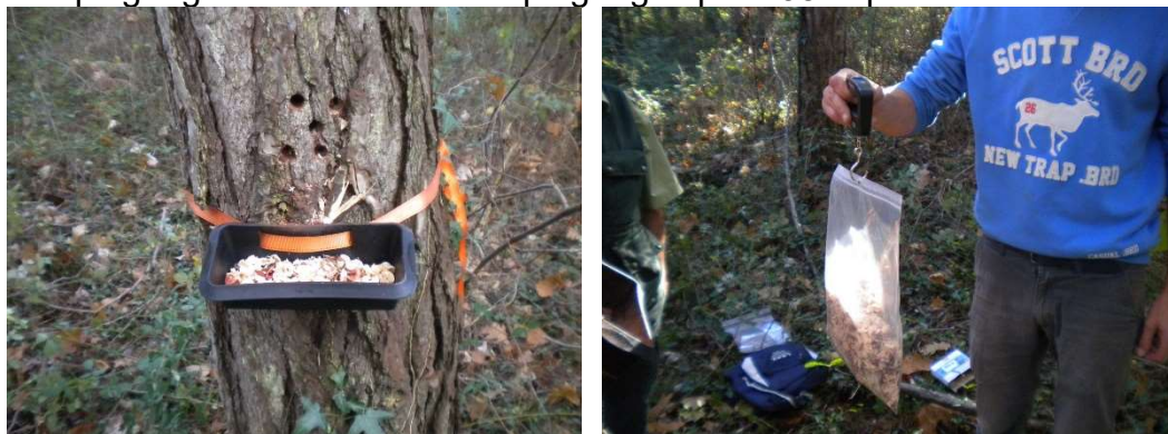
Prélèvements de copeaux par la FREDON pour recherche de nématode

Les piégeages Monochamus : 7 piégeages pour 38 captures