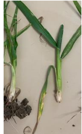
Dégâts de mouche ; pied en poireau et dernière feuille courte

Plante : La dernière feuille reste verte mais est beaucoup plus courte. Elle a du mal à s'extraire de la gaine foliaire. Le symptôme caractéristique est au niveau du pied : le pied est épaissi, en forme de poireaux. Seul le maître brin semble être touché. La larve est visible en découpant la tige. Elle dévore l'épi.