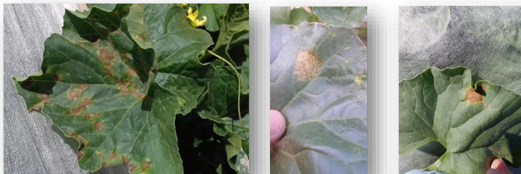
Taches de mildiou sur feuille

Des produits de biocontrôle peuvent être utilisés en préventif pour limiter l'apparition de mildiou. Pour plus d'informations rapprochez vous de votre conseiller. La liste des biocontrôle est disponible ici .