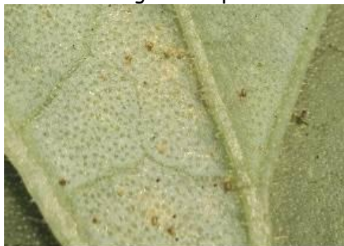
Acariens sur melon

En culture sous abris, la protection intégrée est possible avec Neoseiulus californicus .