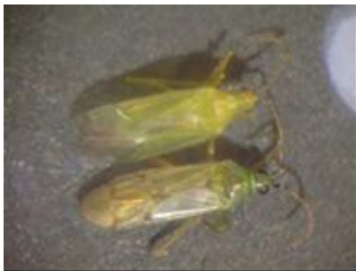
Macrolophus (en haut) et Nesidiocoris (Cyrtopeltis) tenuis (en bas)

⇒ Cyrtopeltis et Macrolophus sont deux espèces apparentées : Cyrtopeltis a une couleur verte plus foncée, des ailes argentées plus foncées et des antennes qui paraissent striées (voir photo)