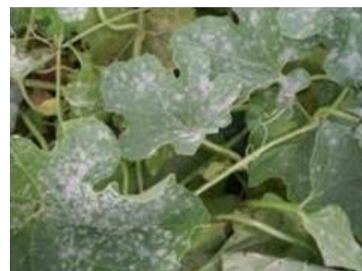
Oïdium sur melon

Surveiller les cultures et intervenir préventivement avant le début de la récolte.