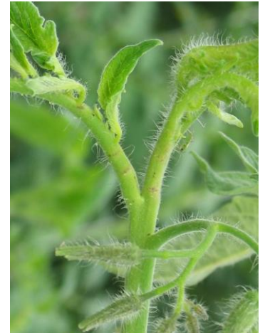
Dégâts de piqûres de Nesidiocoris en tête de plante (anneaux circulaires)