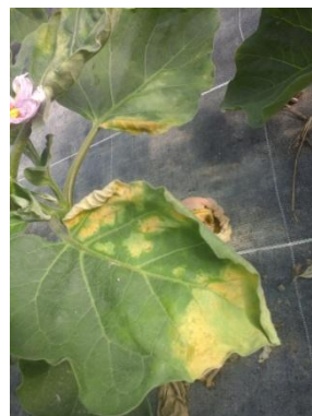
Symptômes de chloroses liés à Verticillium dahliae