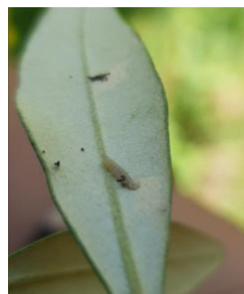
Symptômes et présence de teigne, génération phyllophage

La photo de gauche illustre un symptôme « circulaire » causé par une larve de deuxième ou troisième stade (sortie d'hiver). Sur la photo de droite, la larve sort de sa galerie.