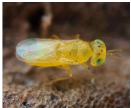
Photo : Aphytis melinus

Une lutte biologique est possible avec des hyménoptères parasitoïdes tels que Aphytis melinus et Encarsia citrina . Les stades d' Aonidiella aurantii parasités sont L2 (second stade larvaire) et début adulte pour les femelles et L2 (second stade larvaire) pro-nymphes pour les mâles.