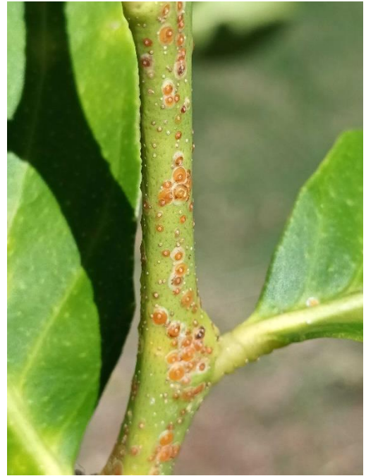
Photo : Cochenille rouge de l'oranger, Aonidiella aurantii (FREDON PACA)

En cas de fortes densités d'individus, des encroûtements plus ou moins importants se forment sur les branches et rameaux. Les arbres sont affaiblis et peuvent mourir. Cette cochenille ne sécrète pas de miellat .