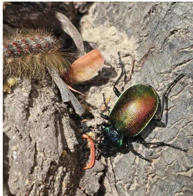
Photo : Calosoma sycophanta prêt à consommer une chenille de bombyx disparate

Il existe également des auxiliaires/ennemis naturels du bombyx disparate qui participeront à la régulation des populations : la mésange, les chauves-souris ou encore certaines araignées ou certains coléoptères, comme Calosome sycophante observé en action ce mois-ci.