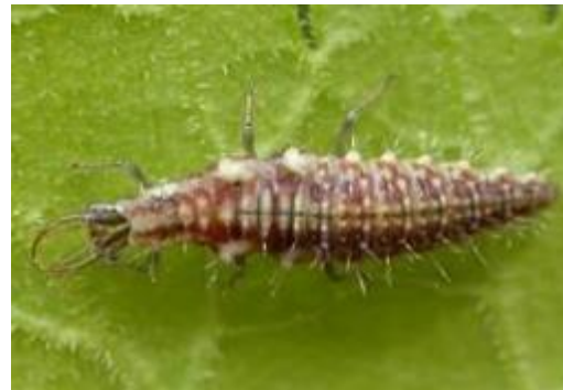
Photos : Œufs de chrysope au bout de leur pédicelle et larve de chrysope en gros plan