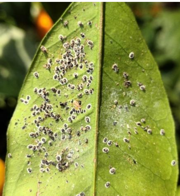
Photo: Feuille de citronnier infestée par l'aleurode floconneux (FREDON PACA)

Attention : Aleurocanthus spiniferus est un Organisme Réglementé de Quarantaine , dont l'introduction et la dissémination sont interdites sur l'ensemble du territoire. De plus, la lutte est obligatoire en vue de son éradication ou, s'il est constaté officiellement que l'éradication est impossible, en vue de son enrayment. Les végétaux de pépinières et de jardineries ainsi que les fruits de Citrus spp. avec feuilles ne peuvent être mis en circulation sur le territoire s'ils sont infestés par cet organisme.