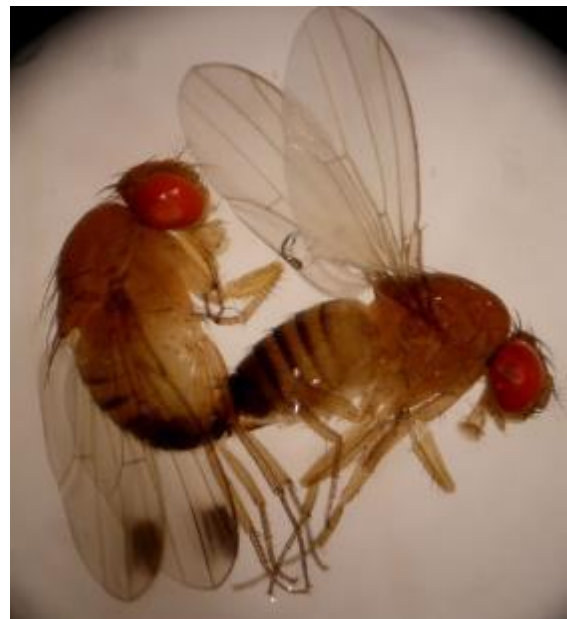
Photo : Adultes mâle et femelle de Drosophila suzukii à ne pas confondre avec ceux des autres drosophiles associées à la pourriture acide (EPHYTIA)

Les dégâts provoqués par ces mouches sont causés par la piqûre de ponte des adultes et l'émergence des larves qui se nourrissent de la pulpe des jeunes fruits .