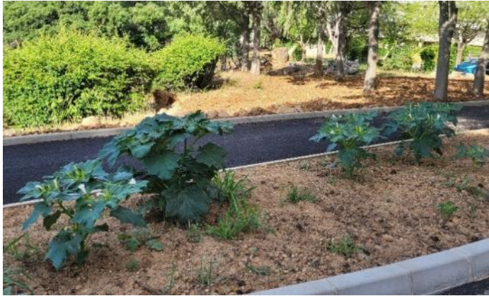
Plants de Datura stramoine dans les Alpes-Maritimes

Originnaire d'Amérique centrale, elle a été introduite en Europe au travers de lots de céréales contaminés. Le datura est une espèce annuelle présente partout en France .