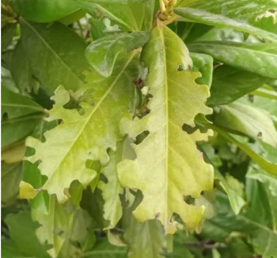
Photo : Feuille grignotée, échancrures caractéristiques de la présence d'otiorhynque

Un observateur nous signale des dégâts liés aux otiorhynques en pépinière sur photinia et laurier-sauce dans le secteur de Hyères (Var). L'intensité des attaques est jugée moyenne .