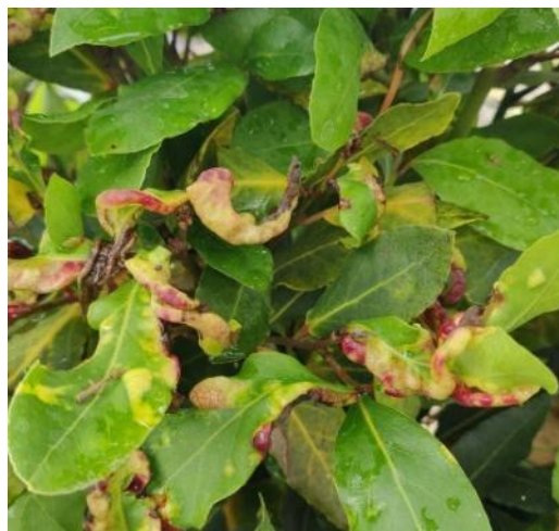
Photo : Pseudo-galle sur feuille du laurier sauce suite à une attaque de psylle