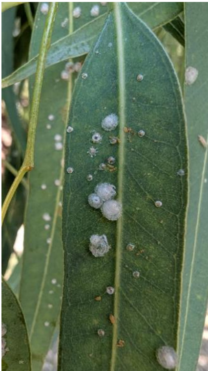
Photo à gauche : Différents stades du psylle, Glycaspis brimblecombei , sur feuille d'eucalyptus

Les psylles sont des insectes piqueurs-suceurs qui s'attaquent à de nombreuses plantes. L'impact direct est esthétique (miellat visqueux, formation de galles) , mais peut affaiblir le végétal en cas de forte attaque.