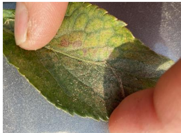
Photos : Symptômes d'attaque d'acarien tétranyque sur feuille de plant de poivron et sur feuille de sureau