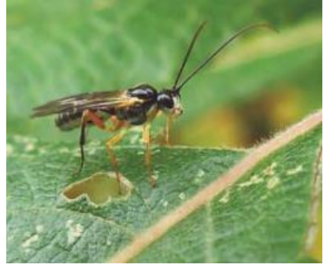
Photo : Rhorus extirpatorius

B Les insectes de la famille des ichneumonidés (hyménoptères) sont des parasites naturellement présents dans l'environnement. Rhorus extirpatorius est le principal ennemi de la tenthrède. Il pond ses œufs sur ou dans les larves. La jeune larve du parasitoïde se développe ensuite aux dépens de son hôte . Limiter les interventions insecticides permet de favoriser la présence naturelle des auxiliaires. Les ichneumons apprécient notamment la présence de plantes fleuries riches en pollen. Les haies à végétation dense et quelques amas de bois ou d'écorces de pins constitueront des abris efficaces pendant l'hiver.