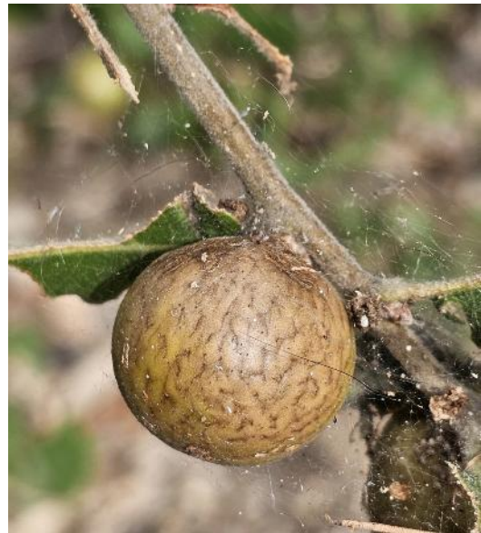
Galle ronde du chêne causée par Andricus kollari

De manière générale, les galles ont un faible impact sur l'état sanitaire du chêne.