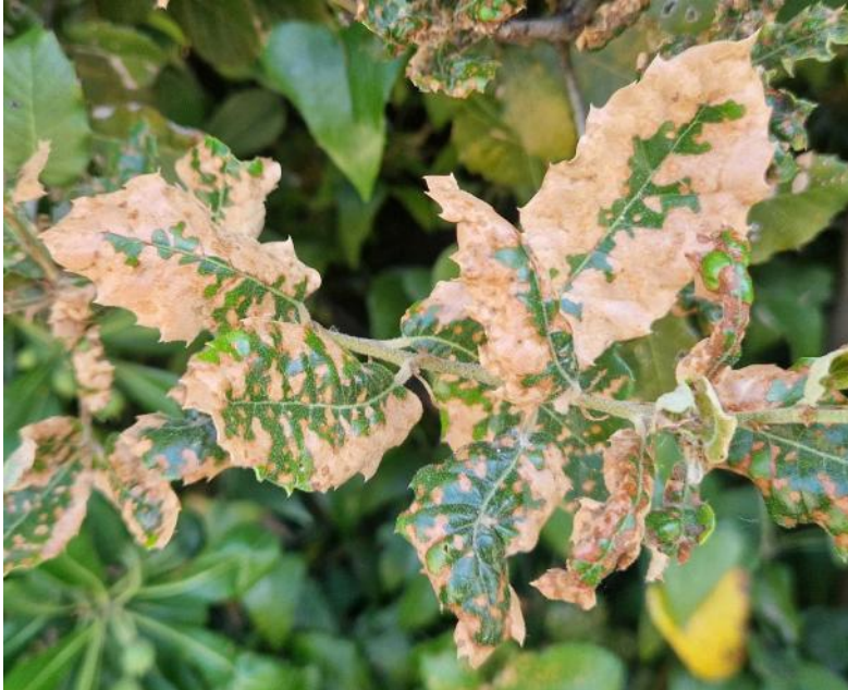
Photo : Feuilles de chênes attaquées par Mycosphaerella maculiformis (FREDON PACA)

Retrouvez la description et les moyens de lutte dans le bulletin précédent .