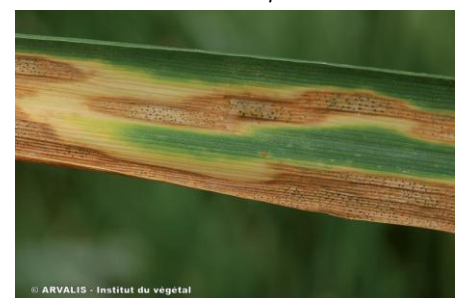
Feuille avec septoriose

Sur les blés les plus avancés, des tâches de septoriose sont observées sur les étages foliaires du haut (F3 définitive). C'est aussi le cas sur des parcelles moins avancées dans les secteurs qui ont été les plus arrosés de la région en mars : sur les parcelles fixes suivies dans le Gard et dans l'Hérault.